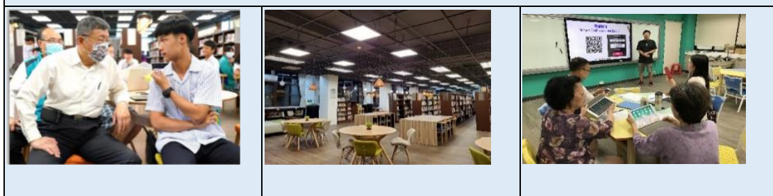
將學校硬體及資訊設備升級，支援師生課程教學及教育活動運作

標準 2.1.2 建構資源運用分配機制，增進課程教學、學生學習、學校社團及特色品牌的教育經營。