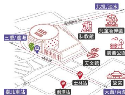
圖 1 臺北市立陽明高中位置圖。

自然環境部分，地處位置交通四通八達的士林區，校門口公車路線計有 15 線，距捷運系統約 500 公尺，以士林捷運站及劍潭捷運站最為便利，自然生態環境場域有關渡自然公園、陽明山國家公園、及基隆河畔河濱公園。人文環境部分，有社教館、故宮博物院、臺灣科學教育館、市立天文科學教育館、市立美術館、臺灣戲曲中心與興建中的臺北表演藝術中心等；加上鄰近大學有市立大學天母校區、東吳大學、中國文化大學、實踐大學、銘傳大學、臺北海洋學院等，均促使本校所在社區堪稱文教區，提供豐富學生學習資源。