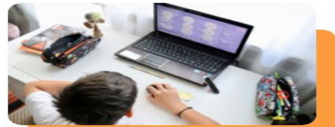
網路課程 - OnO