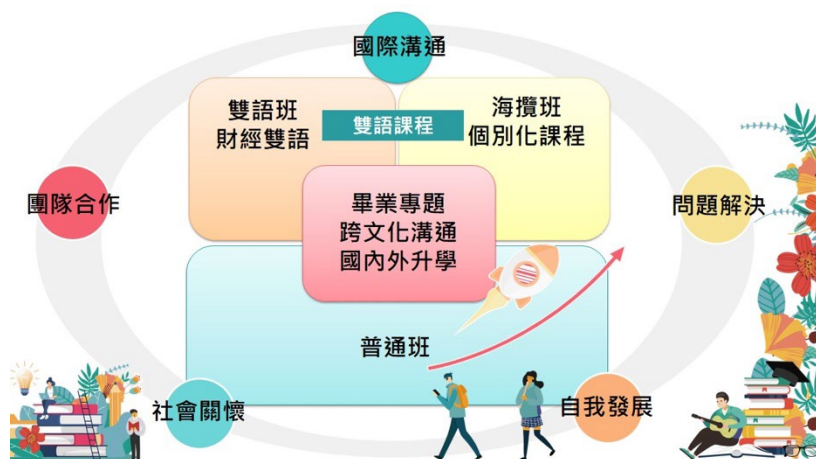
圖：本校課程與海外子女攬才班課程關係圖

本課程地圖，利用本校海外攬才子女專班的師資與教材資源，與海攬班的學生特殊的文化背景結構結合，並且透過校訂必修、團體活動時間與普通班的學生進行形式與非形式的交流，達到陽明學生與海攬學生雙贏的績效。