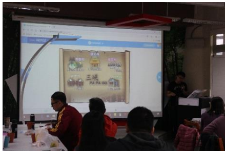
北大高中教師三峽 papa go 課程