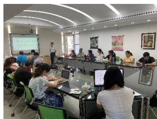
課發會成員凝聚共識