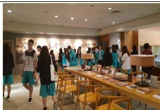
國圖參訪-臺灣的記憶特展