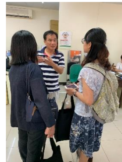
苗栗高中教師分享課程-校園巡禮