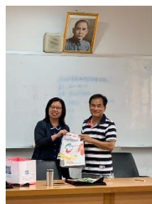
苗栗高中參訪-兩校交換學校校旗