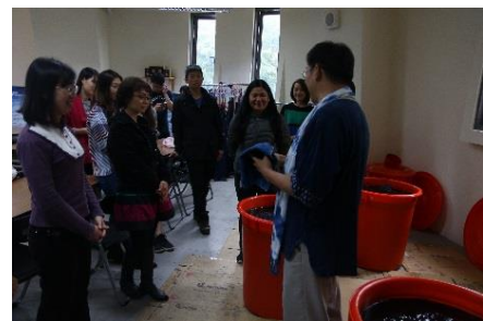
北大高中教師分享課程-藍染