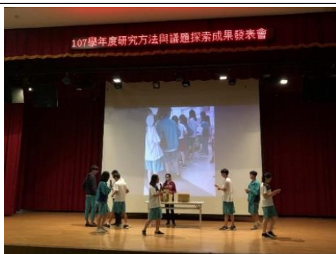
成果發表會-行動方案之行動劇