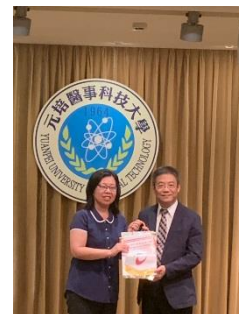
元培科大參訪- 兩校校長交換學校校旗