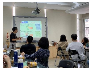
課發會根據學習地圖展開討論