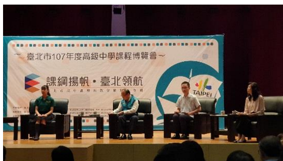
臺北市課程博覽會-由北一女中及本校學生於台上分享