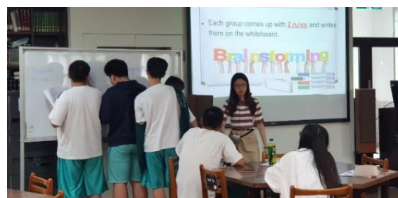
英聞特派員-學生共同討論並上台發表