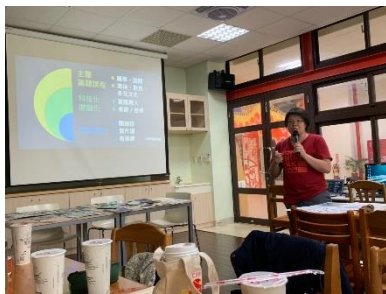
苗栗高中教師分享課程-「行聊、苗青」