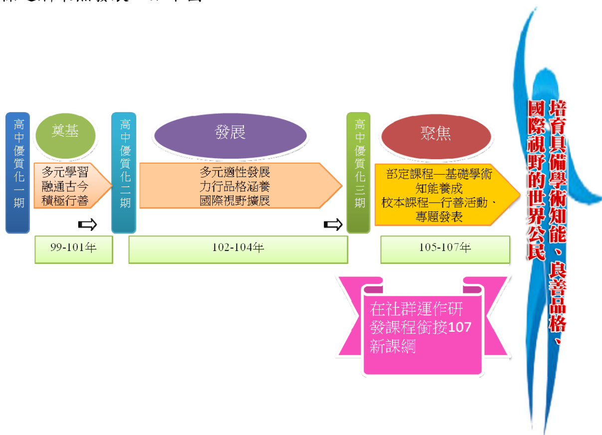
陽明高中校本課程發展歷程脈絡圖