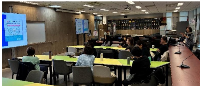
講師分享實際案例

第 26 期家長成長班 11/19(三)辦理「親子情緒教養，從 SEL 學會與孩子共情」講座，邀請家長一同認識 SEL 社會情緒教育，學習理解 Z 世代孩子們的情緒反應與身心狀態，試著建立合宜的溝通橋樑，搭配實際社會案例與新聞事件，家長們均能感同身受，瞭解社會情緒學習之重要性。