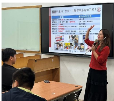
從尿液看健康 台醫大 醫學檢驗生物技術學系

12/5(五)、12/12(五)，為了讓高一及高二學生認識大學學系，輔導室每年都會舉辦學群講座，協助孩子探索學群，今年更是以 ABCD 班群為主軸，邀約大學教授針對相應的學群進行說明及分享，幫助學生更加瞭解學系及未來的工作進路，相信每位學生聽後都是收穫滿滿！