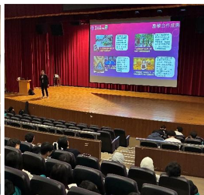
AI 對商業模式的改變 東吳大學 企業管理學系