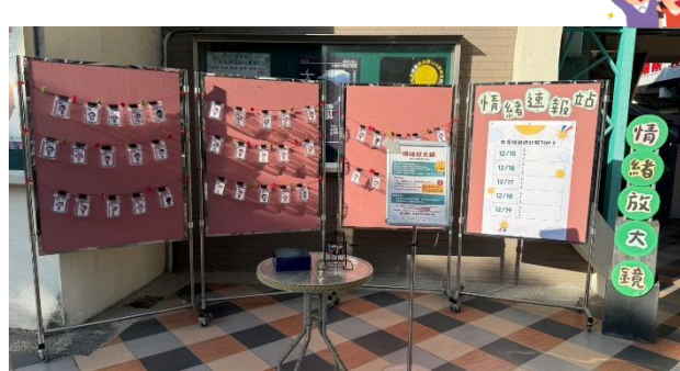
情緒放大鏡 活動區域