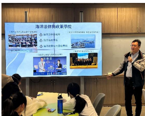
AI 與大數據如何預測氣候變遷 海洋大學 海洋環境資訊學系