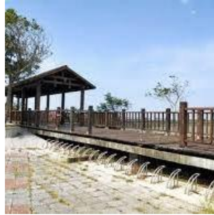
掌潭滯洪池景觀台