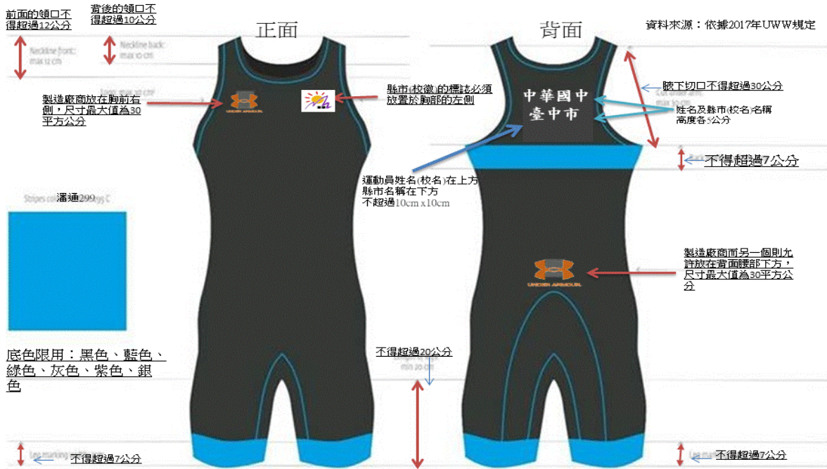
角力服腿的長度必須停止於膝蓋上方，並且不得短於膝上15公分