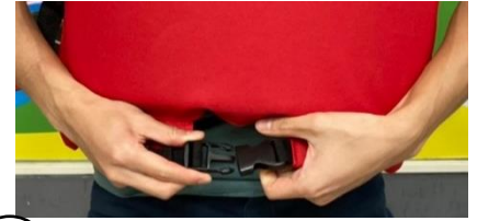
3 正面下方扣環扣好