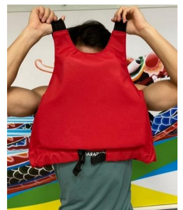
將下方帶子鬆開、扣環打開，即可脫下救生衣