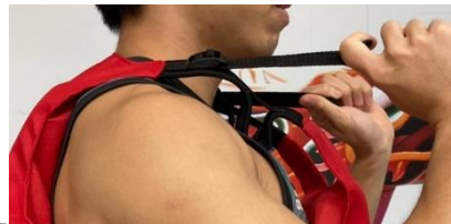
1 肩膀左右各1條帶子拉緊