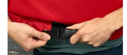
4 扣環扣好後，帶子拉緊