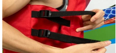
2 腰部左右各2條帶子拉緊