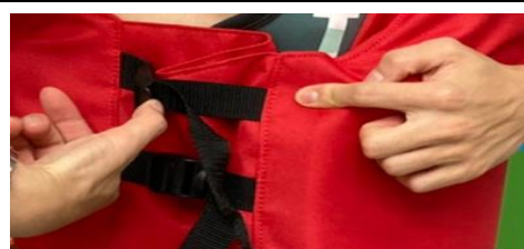
3 腰部兩側扣環，如步驟1操作