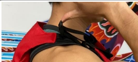
2 順勢往上一推，即可放鬆帶子