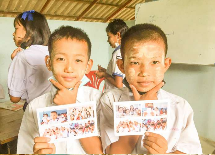
◀ 泰2班團員將營期照片製作成明信片，寫下祝福送到當地