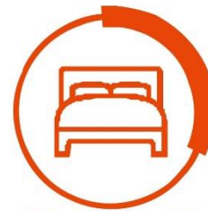
免費住宿 免費宿舍