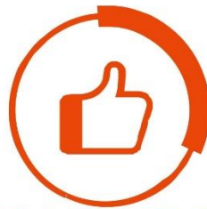
生活助學金 每月 6,000 元