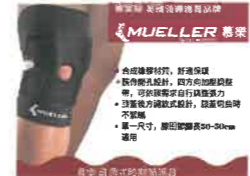
▲慕樂可調式膝關節護具