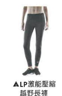
▲LP激能壓縮越野長褲