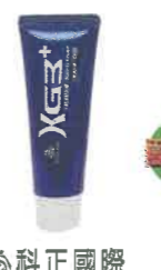
▲科正國際 K3舒緩乳膠