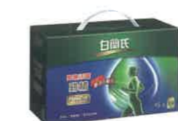
▲白蘭氏關鍵活雞雞精