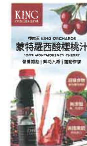
▲櫻桃王濃縮櫻桃汁