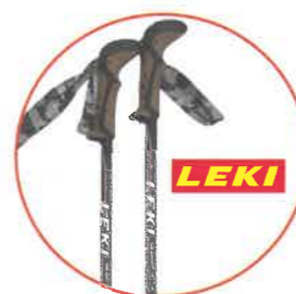
▲德國LEKI 鋁合金登山杖