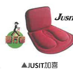
▲JUSIT加喜 凝膠機能坐腰墊