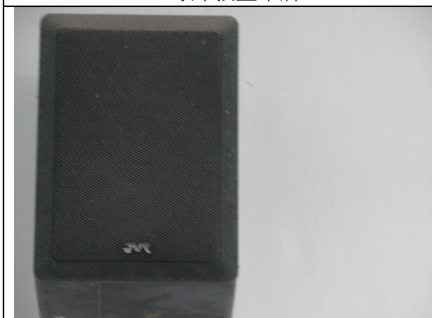
擴音喇叭 2 台