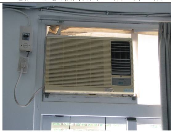
冷氣 2 台