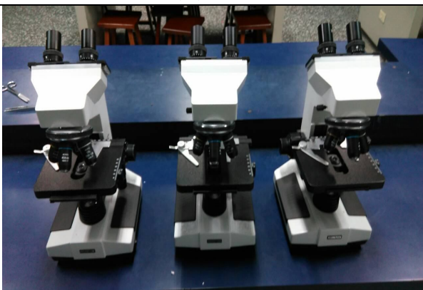
複式雙眼顯微鏡 42 台