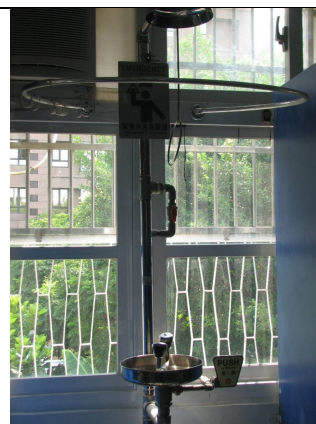
洗眼器、淋浴器一台