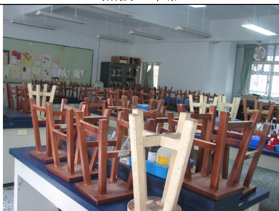
實驗桌 9 張、椅子 61 張