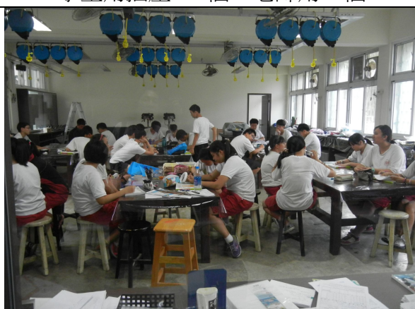
學生用桌子 7 張、椅子 47 張