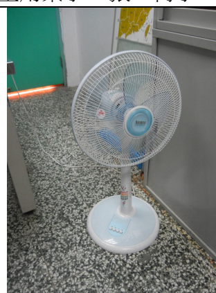
直立式電扇 1 臺