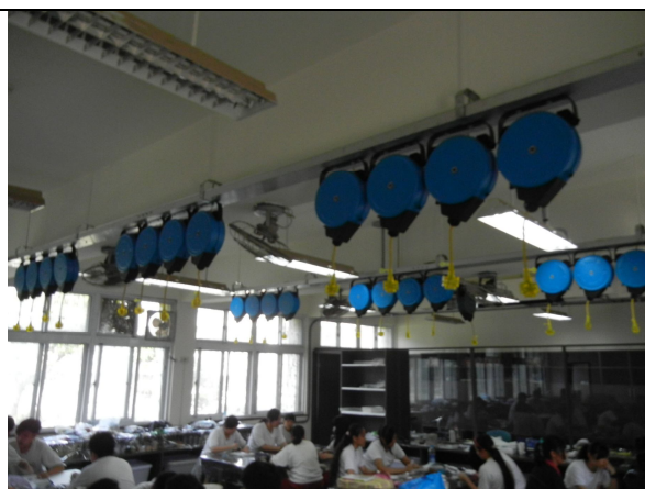
學生用插座 28 個，老師用 1 個