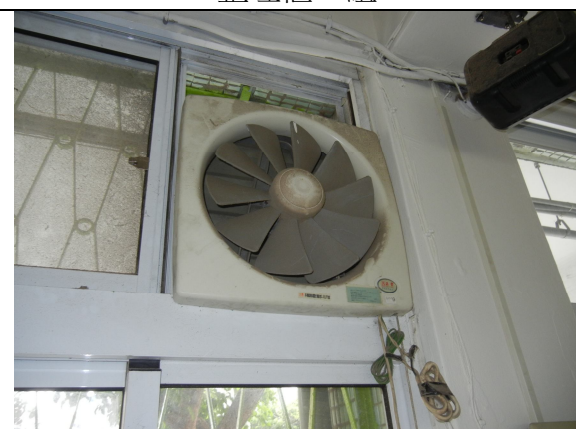
抽風扇 4 臺