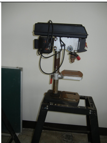
電鑽 3 臺