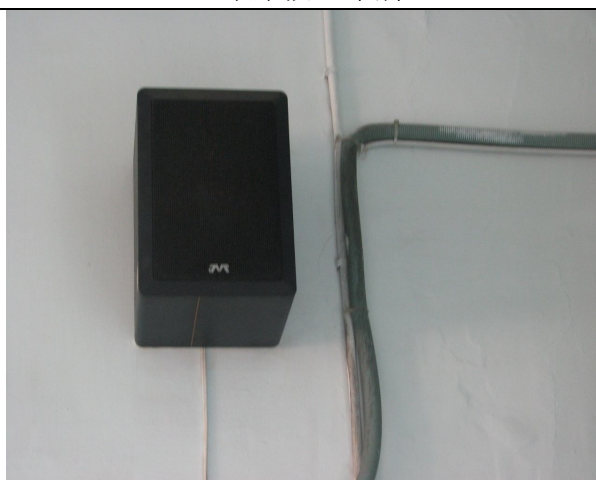
喇叭 2 台