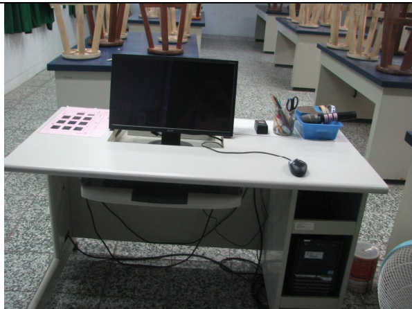
教師用桌椅一組、電腦一組