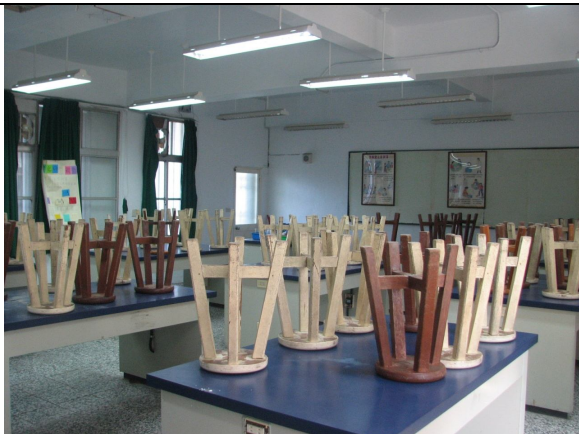
學生用桌子 9 張、椅子 50 張