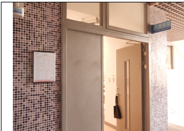
專課教室吊牌、課表