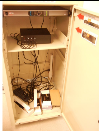
19吋設備機櫃、教室音響組、 無線麥 2 個、友線麥 1 個