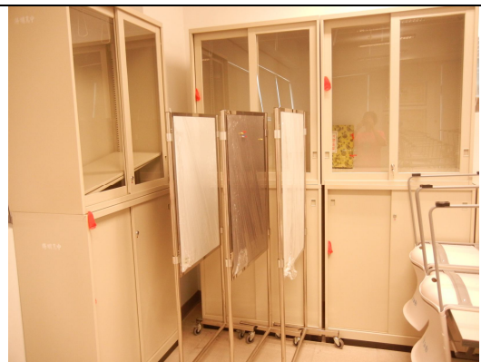
上下櫃 3 組、下櫃 1 個