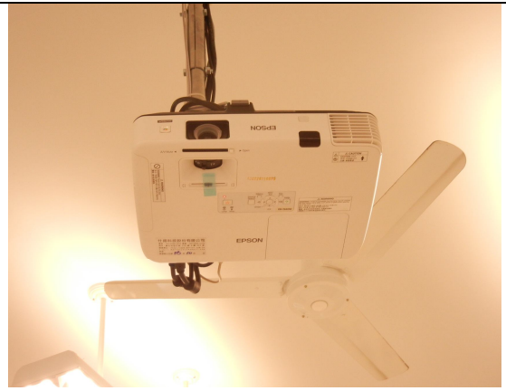
單槍投影機 4500 流明