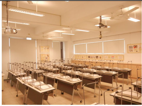
固定式電扇 6 臺天花板