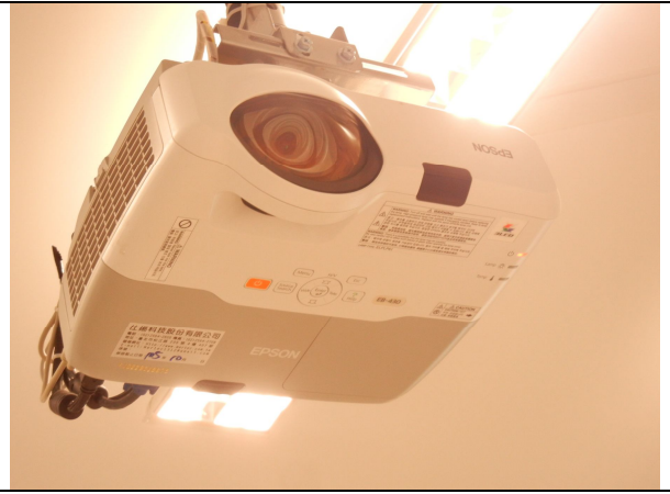
單槍投影機短焦 3000 流明