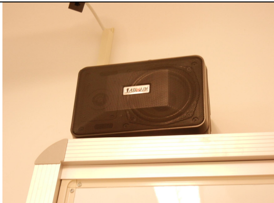
教室音響組(喇叭及掛架 X2)白板上方左右