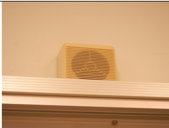
校內廣播系統一個