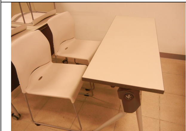
學生用桌子 24 張、椅子 48 張