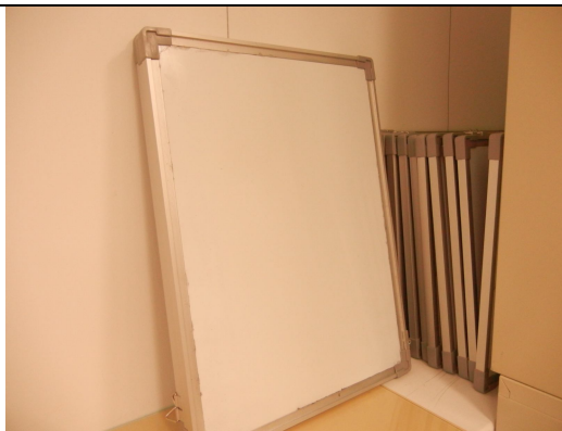
小白板 15 個