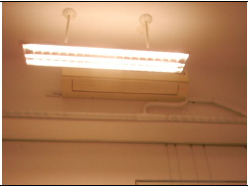
冷氣 2 臺