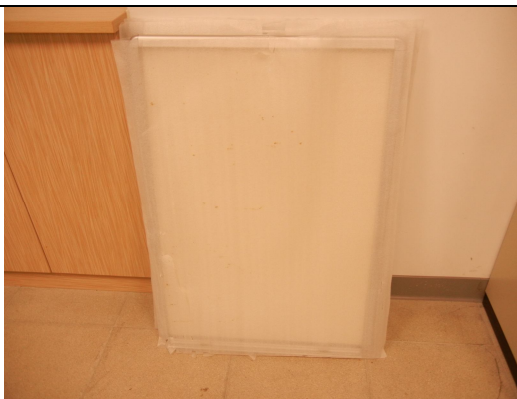
大白板 3 個