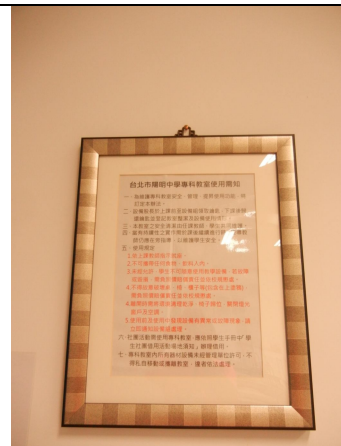
專科教室使用公佈像框