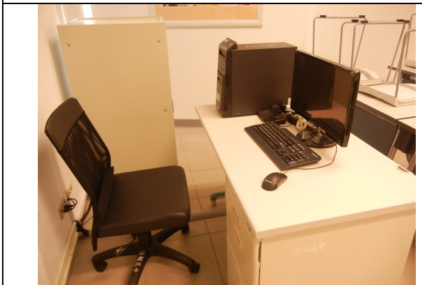
教師用桌、椅各一張、電腦一組