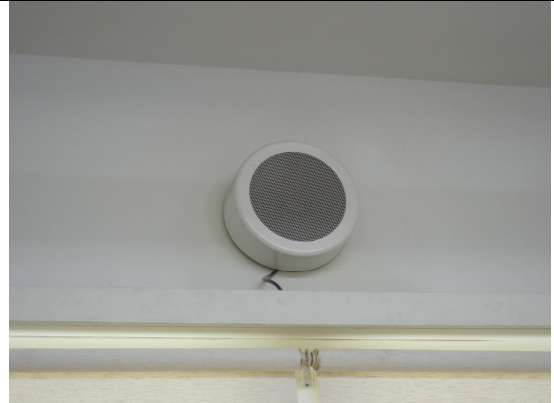
圓形喇叭 2 臺