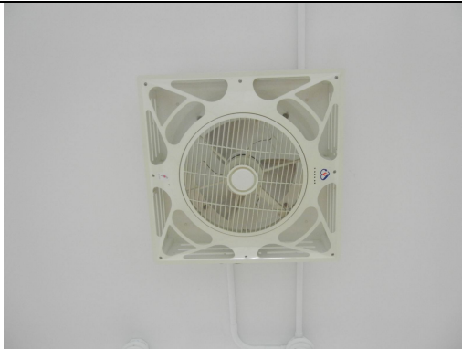
天花板 16 臺