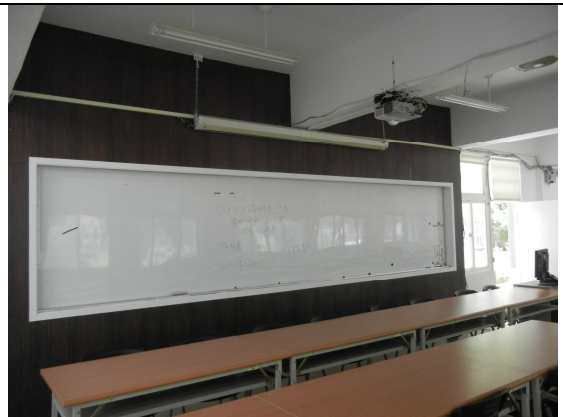
白板、布幕 3 個、單槍臺