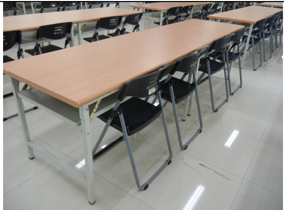
桌子 50 張、椅子 100 張