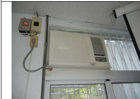
冷氣 2 台