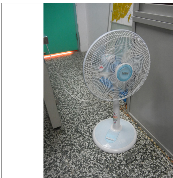
直立式電扇 3 臺