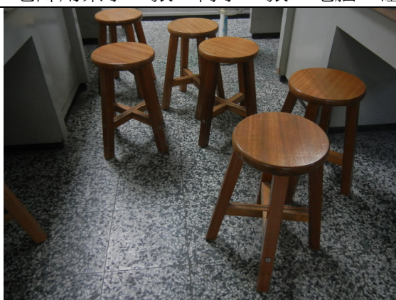
學生用椅子 48 張