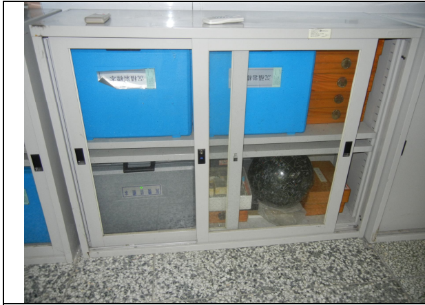
玻璃拉門式鐵櫃 9 個