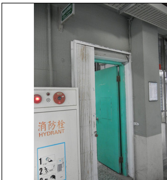
專課教室吊牌、班級課表