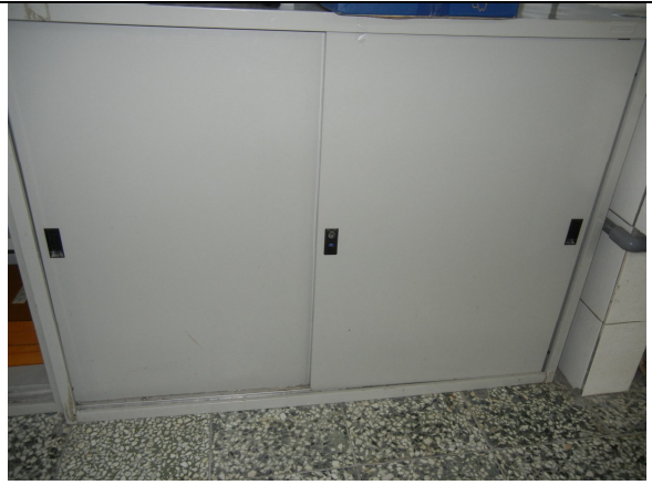
下層拉門式鐵櫃 7 個