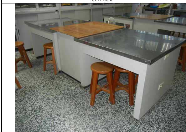
學生用桌子 6 張