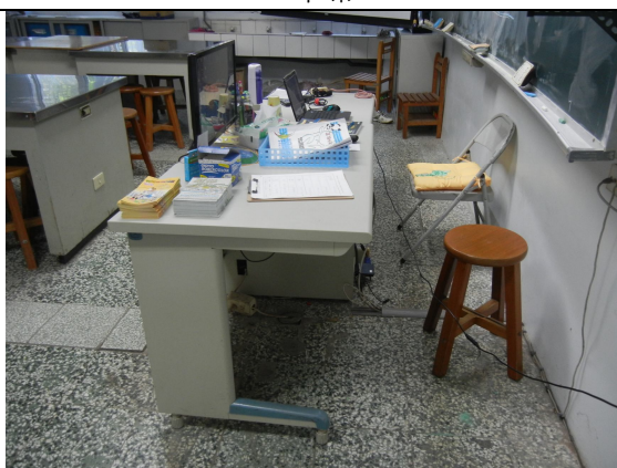
老師用桌子 2 張、椅子 1 張、電腦一組