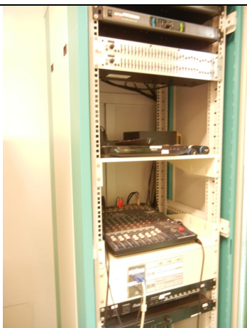
新機櫃、總電源控制器、DVD 影碟機