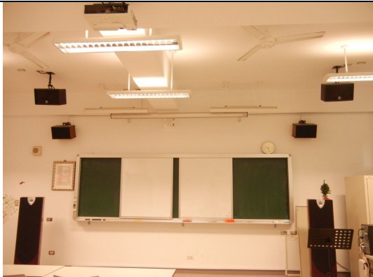
喇叭天花板 (左右各 2 臺)