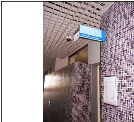
專課教室吊牌、課表