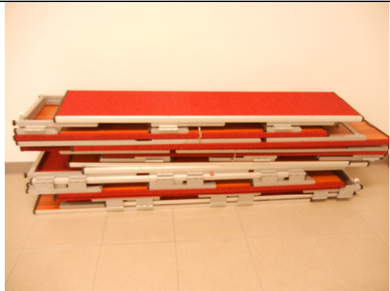
活動式階梯舞台(合唱台)4 個