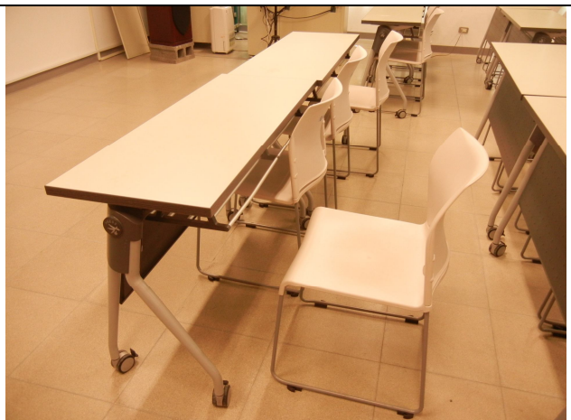
學生桌子 24 張、椅子 44 張