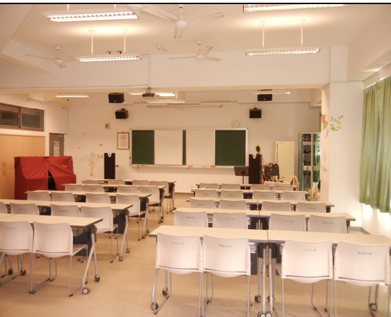
固定式電風扇 6 個