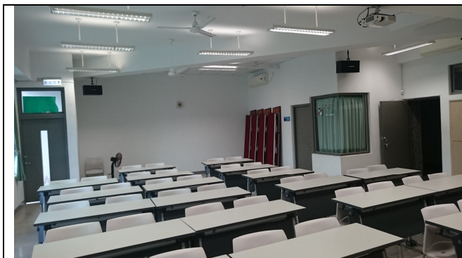
冷氣 4 臺