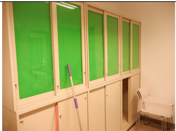
上下鐵櫃 3 組