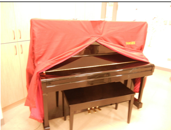
直立式 3 號鋼琴及鋼琴椅