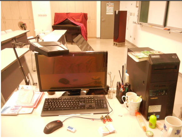
電腦主機、螢幕、教師用桌子、椅子