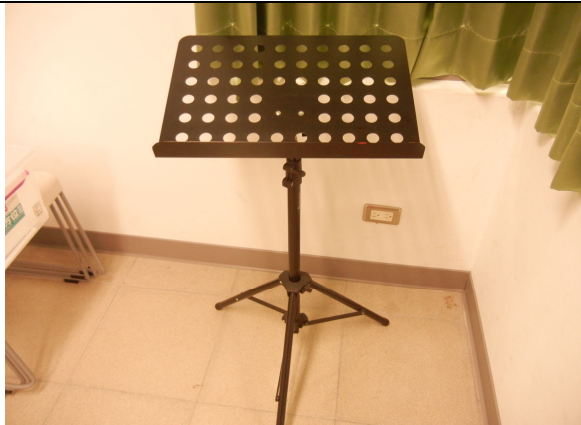
直立式樂譜架 2 個