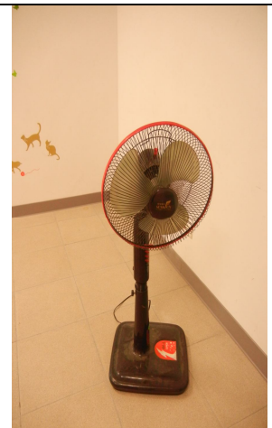
直立式電風扇 3 臺