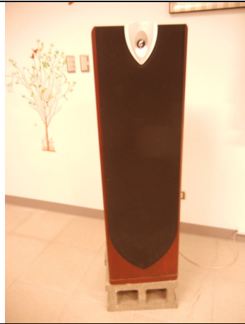
直立喇叭二臺(教室前左右各一)