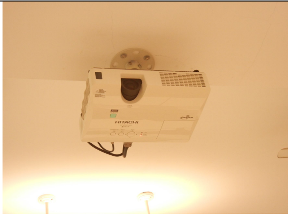
單槍投影機 4500 流明