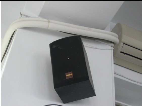
喇叭 3 台