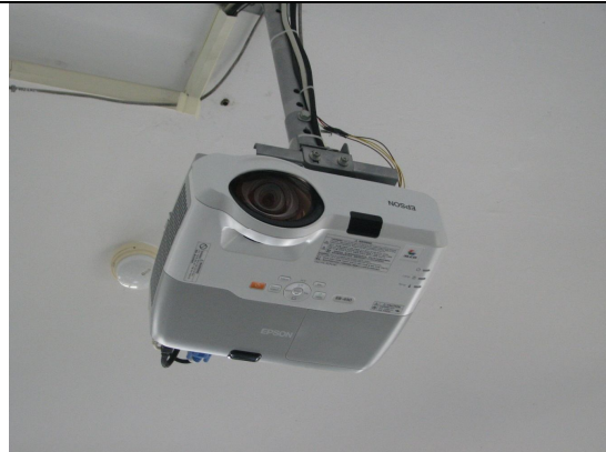
單槍投影機 2 台