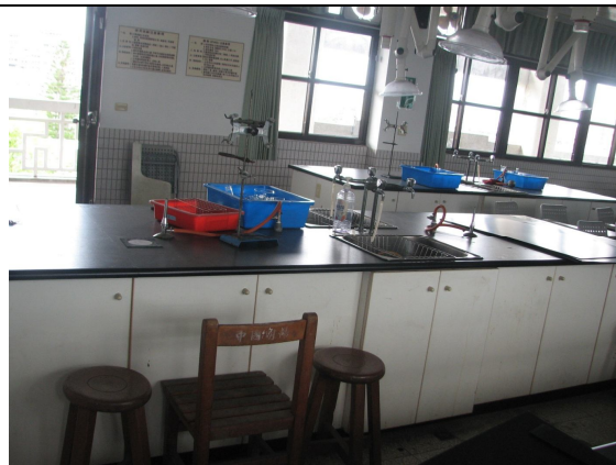
學生用實驗桌 6 張、椅子 40 張