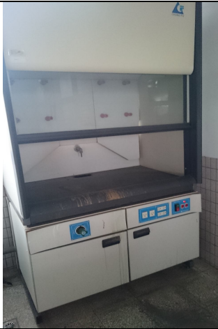
抽風櫃 2 台