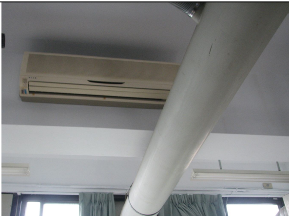
冷氣 4 台