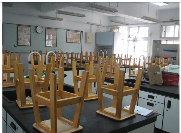
桌子 6 張、椅子 40 張