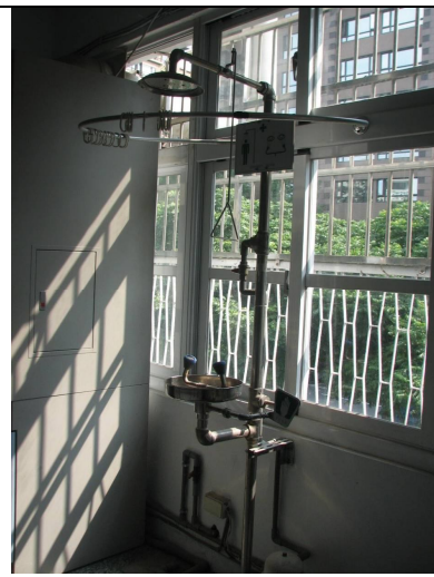
淋身器、洗眼器一台