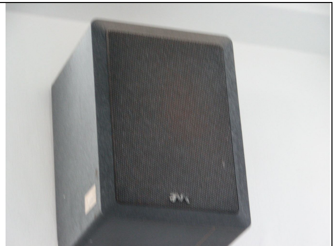
喇叭 2 個