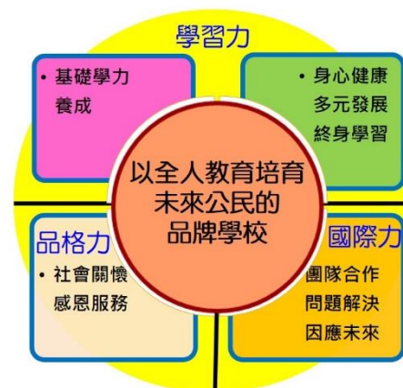
圖 1 學校願景圖

「陽明」係因應九年國民義務教育，於民國 57 年設校，設立初始為「臺北市立陽明國民中學」，取名「陽明」係先總統蔣介石先生為弘揚明代大儒王陽明先生的文武典範與力行精神而命名；之後於民國 83 年順應教改廣設高中政策，改制為完全中學，校名改為「臺北市立陽明高級中學」，同時仍保留國中部，學校自此以高、國中完全中學的型態存在至今。因此學校自立校以來即以王陽明先生的教育學說為校本位核心價值展開經營，為使學生易知易行，以「誠、敬、知、行」四字為校訓，衍伸其意則是「真誠、禮敬、求知、善行」。近年來為因應全球化、國際化趨勢並符合學校辦學目標，確認學生基本學力的養成，亦呼應陽明學說「求知力行」的立校精神，本校即以培養學生具備「學習力、品格力、國際力」三大面向能力為校務經營核心理念目標，企圖打