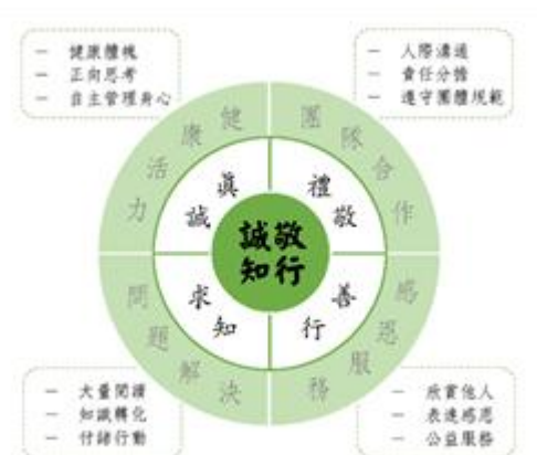
圖 2 陽明學生圖像

在確定學校願景後，我們分析歷屆陽明學子的優劣勢與特質，想像陽明學子在踏出校園後所散發的氣質及特色，並參照民國 103 年 11 月底公告的新課程綱要總綱，透過各科教學研究會的全面討論，復經課綱核心小組的資料蒐集、分組討論、對話共識、意見整合等過程，我們發