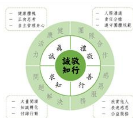
圖 2 陽明學生圖像

在確定學校願景後，我們分析歷屆陽明學子的優劣勢與特質，想像陽明學子在踏出校園後所散發的氣質及特色，並參照民國 103 年 11 月底公告的新課程綱要總綱，透過各科教學研究會的全面討論，復經課綱核心小組的資料蒐集、分組討論、對話共識、意見整合等過程，我們發